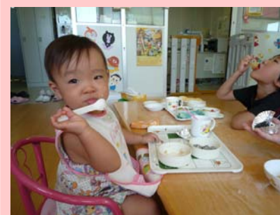
もぐもぐ。じょうずにたべてるでしょ。