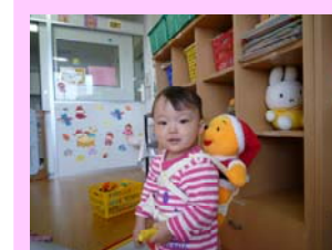
ごちそうさまでした。 いっぱい食べたよ。