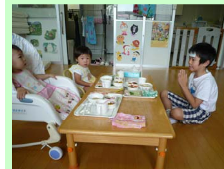
みんなでいっしょに「いただきます」

内容は、①栄養バランスを考えた献立で、②おかずを一口大にカットしたりうどんを刻むなど年齢に合わせて食べやすくし、③消化のよいものや油抜きなど体調に合わせた配慮食や、④アレルギー対応など、個々のニーズに合わせた内容を心がけています。離乳食は、前期、中期、後期の段階を踏まえた上で、症状によっては段階を戻すなどして、無理なく食べることができるようにしています。